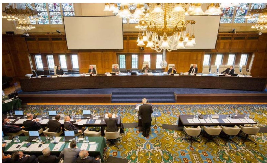
(南シナ海仲裁裁判所プレスリリース)

仲裁裁判所は、これら争点の全てに管轄権があると決定し、審理を開始したのであった。