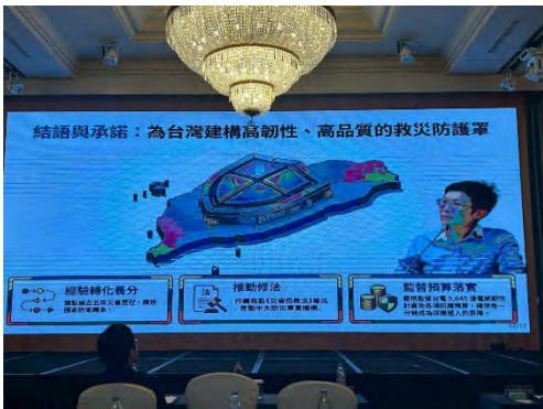
講演内容の一例。制度改革・資源投入・実行体制の強化を通じたレジリエンス構築の方向性が提示されている。