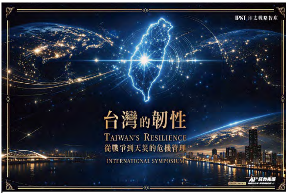
台湾全体を象徴するビジュアル表現。レジリエンスを国家的課題として位置付けるメッセージが強く示されている。