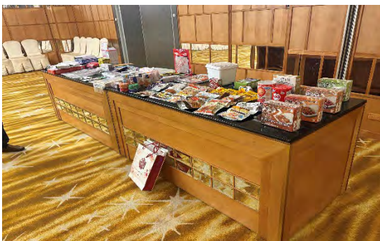
非常食・生活備蓄の実物展示。本展示は日本企業によるものであり、当日の講演者によって紹介された。講演者は東日本大震災時に台湾から受けた支援への「恩返し」として、災害経験から得られた知見の共有を強調した。国際的な相互支援と知見の循環が、市民レジリエンス形成に接続されていることを示す。