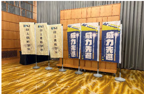
主催シンクタンクおよび企業スポンサーの掲示。民間企業がレジリエンス形成に主体的に関与する構造を示す。