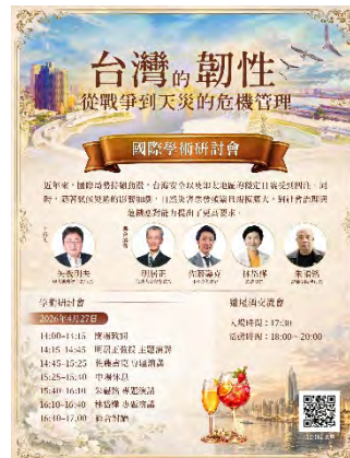
フォーラムの公式案内。戦争と自然災害を統合的に扱う危機管理テーマが明確に設定されている。